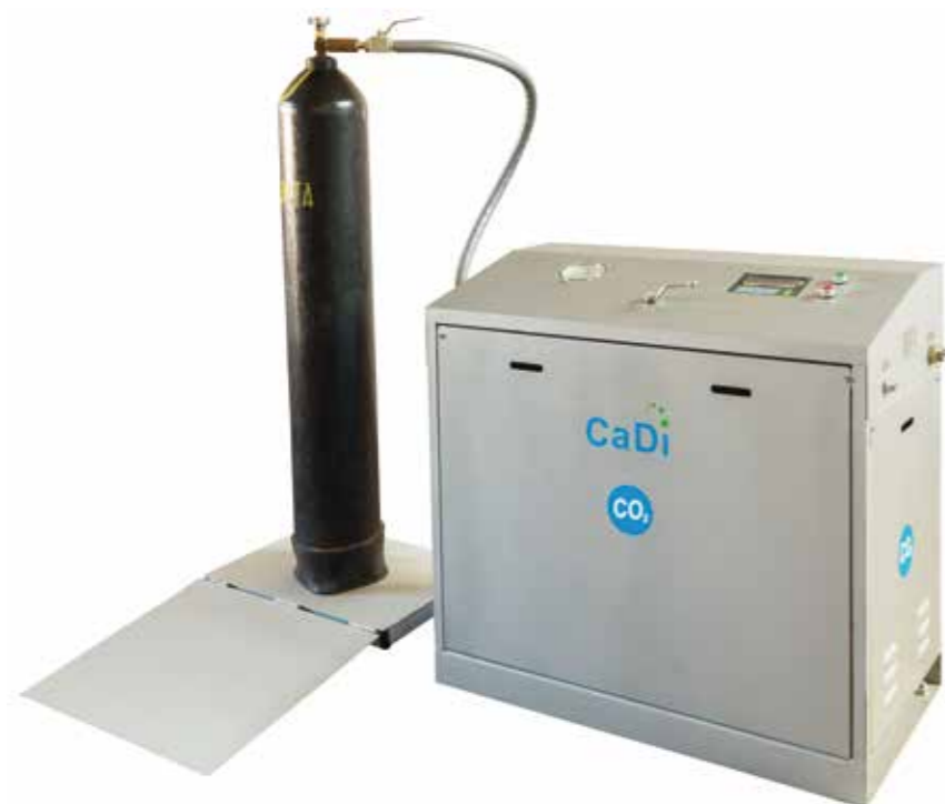
Станция зарядная углекислотная CZY-800 и CZY-800Д.

Станция зарядная углекислотная CZY-800 предназначена для: